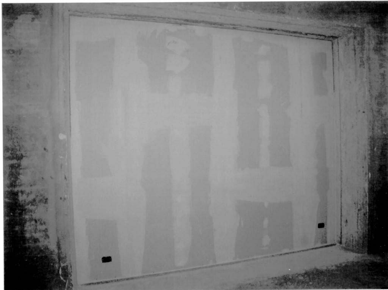
Fotografia del campione.