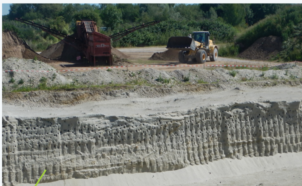
Rinnova gli habitat temporanei (per esempio con degli argini per la rondine riparia)