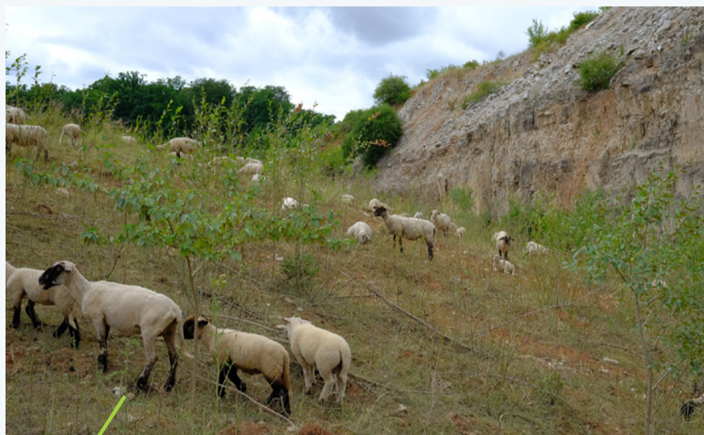
Lascia che il bestiame possa pascolare in appropriate zone inutilizzate della cava