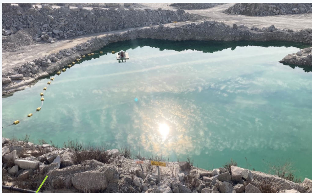
Proteggi stagni temporanei con dei massi