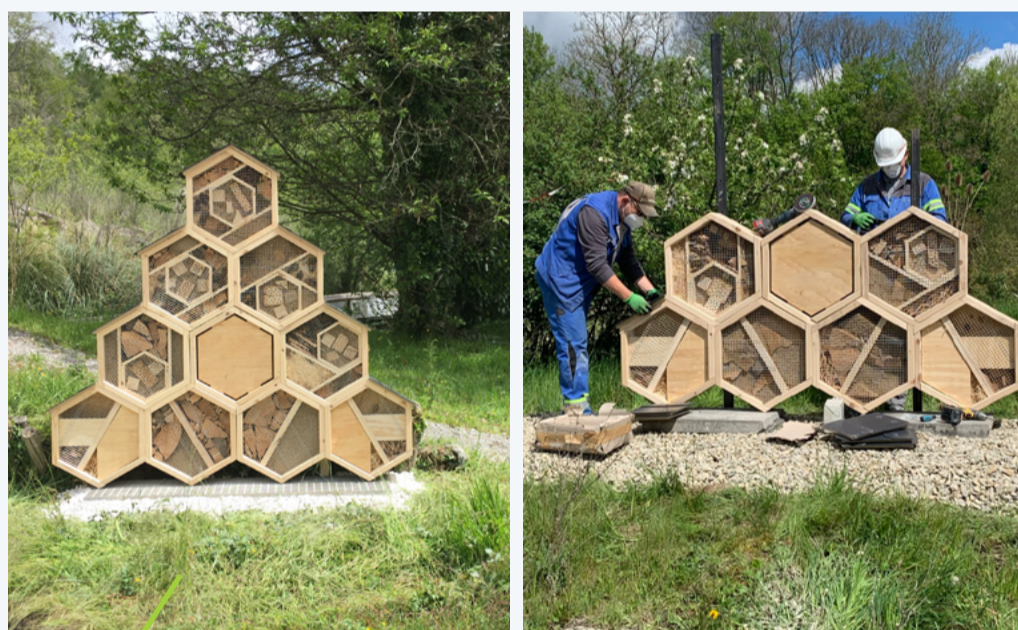
Informa e forma i dipendenti a proteggere e promuovere flora e fauna, per esempio gli insetti

La protezione della biodiversità è una responsabilità condivisa. Collaborare e condividere il sapere con esperti e portatori d'interesse locali aiuta a svolgere attività economiche nel miglior interesse del nostro ambiente – facendo una vera differenza per tutti.